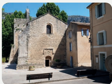
Fontaine de Vaucluse